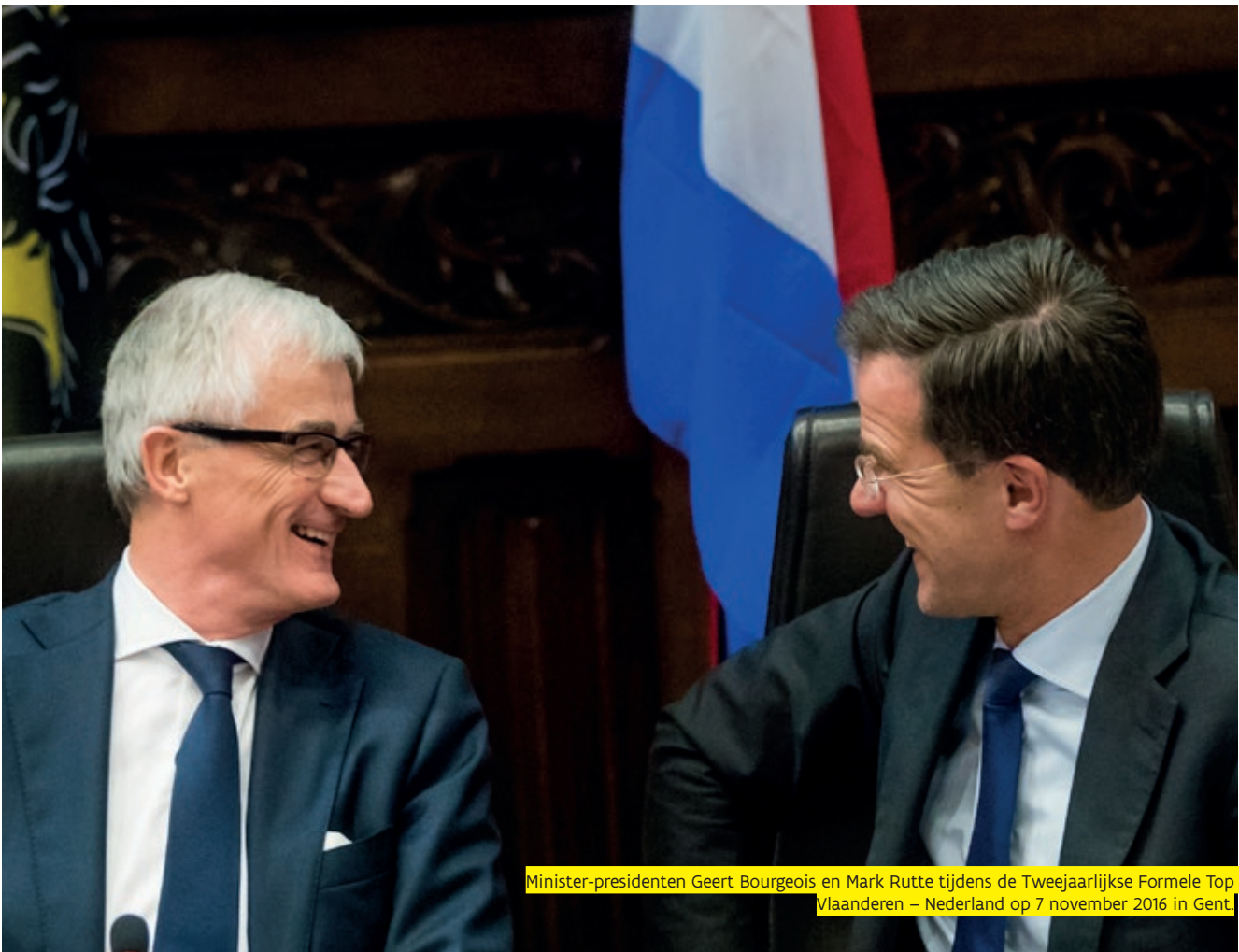
Minister-presidenten Geert Bourgeois en Mark Rutte tijdens de Tweejaarlijkse Formele Top Vlaanderen – Nederland op 7 november 2016 in Gent.

In de voorbereiding van de Top houdt de diplomatieke vertegenwoordiging van Vlaanderen in Nederland de belangrijkste vormen van institutionele samenwerking tussen beide landen bij. De Algemene Afvaardiging speelt daarbij een liaison-rol tussen vakdepartementen. De Algemene Afvaardiging van de Vlaamse Regering stimuleert die samenwerkingsvormen ook zoveel mogelijk en neemt acte van nieuwe, interessante samenwerkingsideeën langs de lijnen van de hierboven geschetste strategische doelstellingen van de samenwerking. Die opbouw wordt zoveel mogelijk met de Nederlandse instanties gedeeld. De top wordt zo de bekroning van een steeds intensievere samenwerking op zoveel mogelijk terreinen tussen Vlaanderen en Nederland.