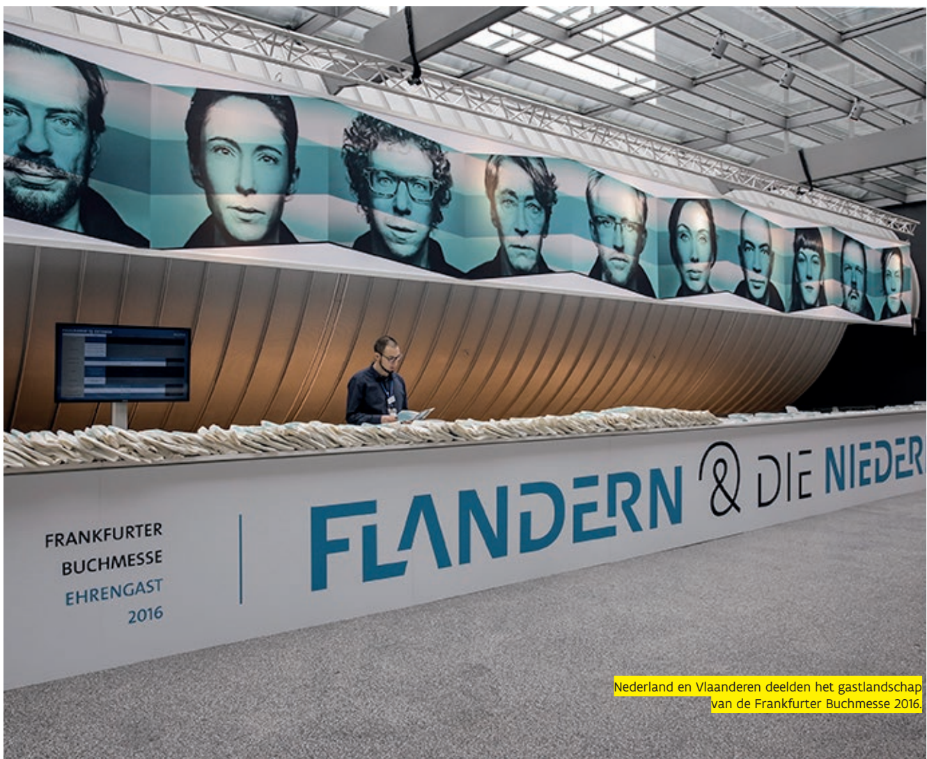
Nederland en Vlaanderen deelden het gastlandschap van de Frankfurter Buchmesse 2016.

Ook in Nederland blijft het nastreven van de specifieke belangen van Vlaanderen aan beperkingen onderworpen. De vrije werking van de Vlaamse Vertegenwoordiging is er weliswaar bij de ambtenarij en bij relevante delen van de politiek verworven. Er worden de Algemene Afvaardiging van de Vlaamse Regering of de Vlaamse Economische Vertegenwoordiging in hun alledaagse werking geen beperkingen opgelegd. Maar Nederland houdt vanzelfsprekend wel scherp de prerogatieven van België federaal in ere. Voor Vlaanderen betekent dit dat samenwerking op internationaal vlak met Nederland kan, maar dan wel binnen de logica van het Belgische federale systeem. Door de nabijheid en bekendheid kan samenwerking met Nederland in bepaalde gevallen wel een opstap mogelijk maken naar ruimere samenwerkingsverbanden.