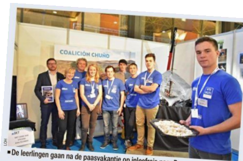
De leerlingen gaan na de paasvakantie op inleefreis naar Peru.

"Het doet me enorm plezier dat hij een thesis maakt in het ver-